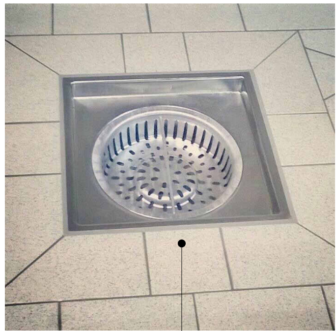
Detail polaganja keramike: Keramiko v oddaljenosti 1m od talne rešetke je potrebno položiti s padcem 1% proti talni rešetki.